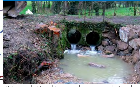
Ruisseau du Grand étang sur la commune de Nandax